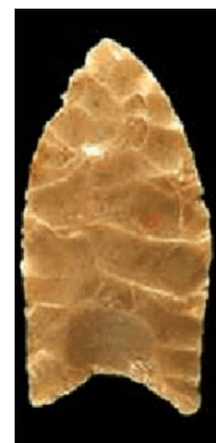
Rys. 1.3.1b. Ostrze kultury Clovis.