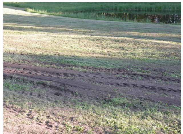
Rys. 3. Przykład dewastacji na skutek złego koszenia traw. Prowadzi to do erozji gleby i wymierania gatunków łąkowych.