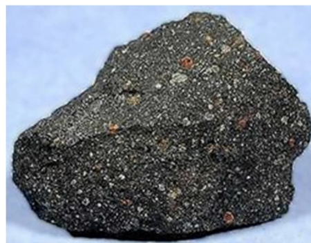
Rys. 1.3.1a. Meteoryt Murchisona